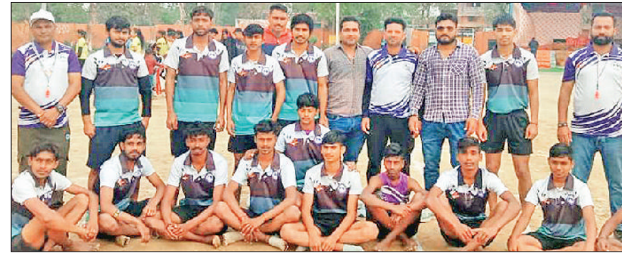
पानीपत। हरियाणा राज्य खो-खो चैपियनशिप के समापन पर विजेता टीम के साथ अतिथिगण।

कन्या स्कूल खेल मैदान गांव मनाना में 43वीं हरियाणा राज्य खो खो चैपियनशिप का समापन हुआ। प्रतियोगिता में गांव मनाना के लड़के व लड़कियों की टीमों ने प्रथम स्थान हासिल किया। जबकि महिला वर्ग में जिला जींद द्वितीय तथा तृतीय स्थान कैथल और फतेहाबाद ने हासिल किया। वहीं पुरुष वर्ग में जिला जींद ने द्वितीय और कैथल ने