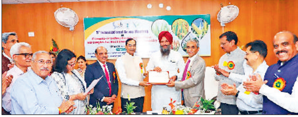
खालसा एक्सपोर्ट के एमडी को सम्मानित करते अतिथि।