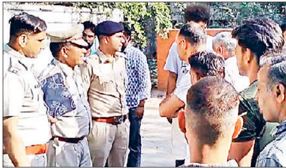
पानीपत सिविल अस्पताल में पीडित परिजनों को समझाते हुए पुलिस अधिकारी।

पानीपत के सिविल अस्पताल स्थित एसएनसीयू वार्ड में नवजात की मौत हो गई। एसएनसीयू वार्ड में वैटिलेटर नहीं मिलने के कारण यह घटना हुई। वहीं वार्ड में एक ही वैटिलेटर है और वह भी खराब पड़ा है। जबकि वार्ड में भर्ती होने वाले नवजातों को वैटिलेटर की सख्त जरूरत होती है। डॉक्टरों के पास नवजातों को यहां से हायर हेल्थ सेंटर में बच्चों को रेफर करने का विकल्प है, लेकिन आला अधिकाधिकारियों ने डॉक्टरों से नवजातों को रेफर करने से इनकार