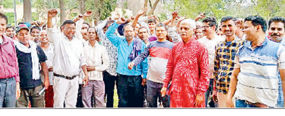
टेक्सटाइल इंडस्ट्री में कार्य करने वाले स्पिनिंग उद्योग के मजदूर अपनी मांगों को लेकर प्रदर्शन करते हुए।