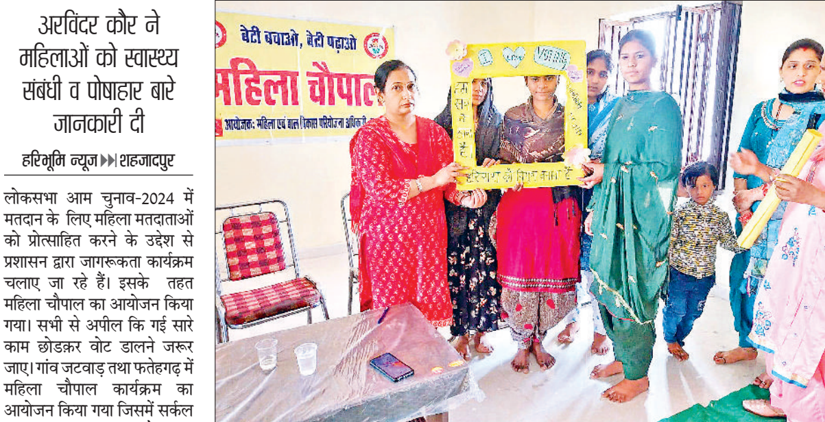
शहजादपुर। महिला चौपाल के दौरान मौजूद महिलाएं।