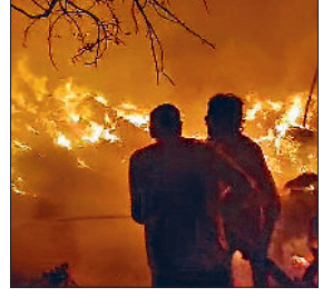
वेस्ट गोदाम में लगी आग को काबू करते हुए दमकल कर्मी।

पानीपत की देवपुरी रोड स्थित एक वेस्ट गोदाम में भयंकर आग लगी गई। आग लगने की सूचना स्थानीय लोगों ने गोदाम मालिक को दी। सूचना मिलते ही गोदाम मालिक मौके पर पहुंचा।