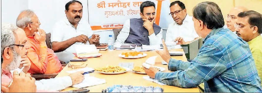
पानीपत। लोकसभा चुनाव की तैयारियों को लेकर बैठक करते हुए भाजपा नेतागण।