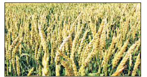
यमुनानगर क्षेत्र में खेतों में पकने को तैयार खड़ी गेहूं फसल।

मौसम में अचानक बढ़े तापमान से खेतों में पकने को तैयार खड़ी गेहूं पर असर दिखना शुरू हो गया है। किसानों की मानें तो यदि मौसम में तापमान अगले कुछ दिन तक इसी तरह बढ़ता रहा और तेज हवा चलती रही तो गेहूं की पैदावार कम होने की आशंका है और यह समय से पहले पक सकती है। जिसे लेकर किसान चिंतित हो उठे हैं। वहीं कृषि विशेषज्ञों ने किसानों को बढ़ते तापमान और तेज हवा के चलते दिन के समय सिंचाई न करने की सलाह दी। उधर, बुधवार को जिले